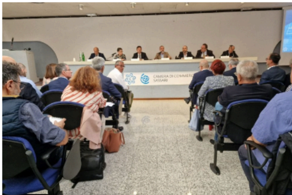
La presentazione del documento

Presentato a Sassari il "Libro bianco" per le grandi opere. Camera di Commercio: "Su 244 regioni Ue l'Isola è al 177esimo posto". La vicepresidente della Regione: "Risorse e progetti ci sono, ma siamo imbrigliati"